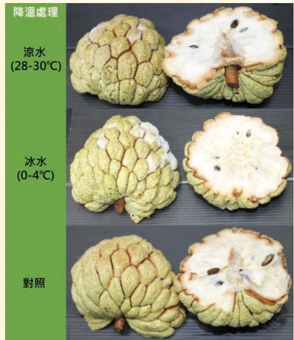
圖7. 番荔枝臺東2號後熟成熟度8分之夏期果，經不同冷卻處理後凍果於貯藏(-20℃) 1年之剖面外觀變化。