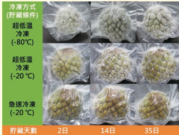
圖2.番荔枝臺東2號7分熟果實經鹽水殺菁抑菌冷凍外觀變化