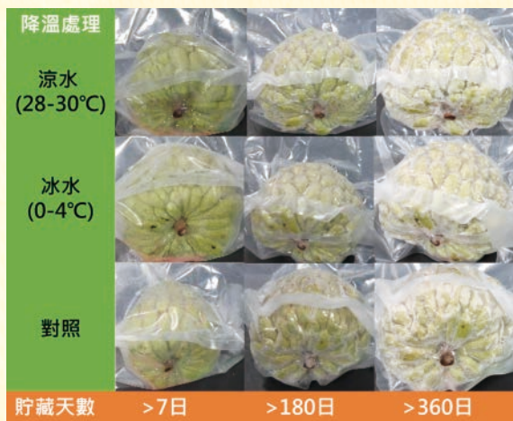
圖6. 番荔枝臺東2號後熟成熟度8分之夏期果，經不同冷卻處理後凍果於貯藏(-20℃)期間之外觀變化。

全果冷凍加工技術其製程為選別(後熟程度8分之果實)、殺菁抑菌(100℃ 2%鹽水)、冷凍(-80℃超低溫約18-24小時)、單果真空包裝及貯藏(-20℃)，貯藏時間可超過1年。全果冷凍技術開發可增進果實利用及便利性，減少消費者誤判果實後熟程度及鮮果食用期限之困擾，並能維持果實品質，兼具耐貯運及延長櫥架壽命效益。