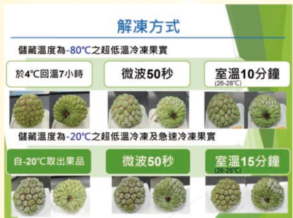
圖5.番荔枝臺東2號冷凍果實解凍方式

現較佳(圖2、圖3、圖4)。經品質指標參數分析，在可溶性固形物、酸度、糖酸比及維生素C表現，則以8分熟果實最佳。果實官能品評測試分析，貯藏於-80°C者，先將果實移至4°C冷藏回溫7小時，經微波解凍50秒後，於室溫(26-28°C)放置10分鐘始進行品評；貯藏於-20°C者，微波解凍50秒後，於室溫(26-28°C)放置15分鐘始進行品評(圖5)，果肉風味評分標準如表1。官能品評結果顯示，果實急速冷凍處理容易導致果品解凍後不耐室溫放置，果肉之風味及口感不易維持，評估急速冷凍並不適用於番荔枝臺東2號冷凍果加工處理。8分熟果實搭配超低溫冷凍法處理，官能品評平均分數超過2.0表現最佳，貯藏於-80°C更優於-20°C，惟貯藏條件若以-80°C控制，有其成本投入過高及未來解凍方法繁複之缺點，因此建議果實仍以超低溫冷凍法搭配-20°C低溫貯藏較為可行。食用方式建議可將果實解凍後剖半，利用湯匙挖取果肉食用。