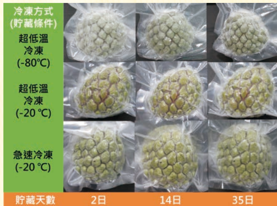
圖3.番荔枝臺東2號8分熟果實經鹽水殺菁抑菌冷凍外觀變化