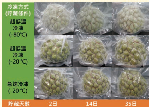
圖4.番荔枝臺東2號9分熟果實經鹽水殺菁抑菌冷凍外觀變化

現較佳(圖2、圖3、圖4)。經品質指標參數分析，在可溶性固形物、酸度、糖酸比及維生素C表現，則以8分熟果實最佳。果實官能品評測試分析，貯藏於-80°C者，先將果實移至4°C冷藏回溫7小時，經微波解凍50秒後，於室溫(26-28°C)放置10分鐘始進行品評；貯藏於-20°C者，微波解凍50秒後，於室溫(26-28°C)放置15分鐘始進行品評(圖5)，果肉風味評分標準如表1。官能品評結果顯示，果實急速冷凍處理容易導致果品解凍後不耐室溫放置，果肉之風味及口感不易維持，評估急速冷凍並不適用於番荔枝臺東2號冷凍果加工處理。8分熟果實搭配超低溫冷凍法處理，官能品評平均分數超過2.0表現最佳，貯藏於-80°C更優於-20°C，惟貯藏條件若以-80°C控制，有其成本投入過高及未來解凍方法繁複之缺點，因此建議果實仍以超低溫冷凍法搭配-20°C低溫貯藏較為可行。食用方式建議可將果實解凍後剖半，利用湯匙挖取果肉食用。