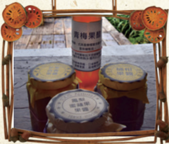
» 轉角上自然的手作果醬與果醋