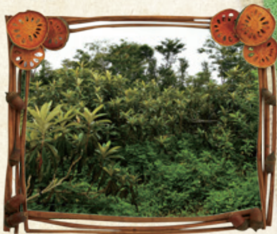
» 轉角·上自然農場豐富的草相生態

現病害徵兆，他仍然例常照顧，除草剪枝，維持樹勢，靜待植株自體復原。陳文輝指出，一般果樹的平均壽命約二、三十年，然而，因慣行農業常過度施肥增加產量，或架設照明設備調節產期，往往減短樹木壽命。轉角·上自然枇杷農場果樹，至今已邁入第十三年，枇杷植株枝葉茂密，樹勢挺拔，亭亭如蓋。陳文輝強調自己至今仍不斷調整剪枝方式，以前他看到枝芽不發花苞，就會剪掉，但去年轉念一想，留下一些徒長枝，讓葉片行光合作用製造養分，後來發現產出的果實不但品質穩定，甜度甚至可以高達16、17度。