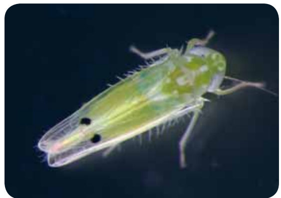
圖 3. 傳播洛神葵菌質體病害之媒介昆蟲 - 二點小綠葉蟬 (放大約 25 倍圖)