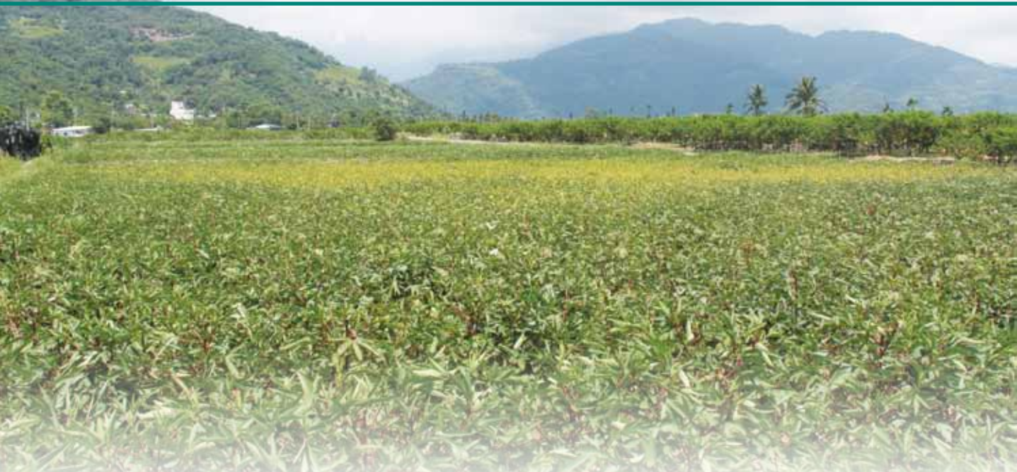
圖 1. 洛神葵菌質體病害田間大面積發生情形。圖片中央大面積黃化區域即為菌質體病害發生區塊。