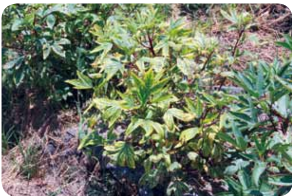
圖 2. 洛神葵菌質體病害之主要病徵為葉片黃化、植株矮小。

植物菌質體病害在田間主要是藉由媒介昆蟲傳播，在由同樣是菌質體造成的甘藷簇葉病病害研究發現，牽牛花、馬麻藤、白牽牛花及長春草等植物為該病菌的中間寄主。洛神葵為一年一作的作物，一般為每年 4 月開始播種，最晚 12 月底即採收完畢。同一塊地接著會種植臺灣藜或小米等其他作物，因此在排除種子傳播的可能性後，顯然菌質體於非洛神葵栽培期間，即已存在於田間的中間寄主，待洛神葵開始種植時，再由二點小綠葉蟬傳播，因此本場也正努力釐清洛神葵菌質體可能的中間寄主，希