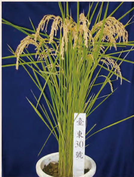
水稻臺東 30 號植株生長情形

臺東 30 號為是本場於民國 91 年完成命名登記之品種，具有優良農藝性狀、穀粒大、千粒重較重，米粒外觀晶瑩剔透，米飯粘彈性佳，食味品質良好等特色，尤其對稻熱病與褐飛蟲、白背飛蟲具有抵抗性，為近年來粳稻較為特殊之品種，先於 94 年 5 月通過為良質米推薦品種，103 年更獲選為優良水稻推廣品種。