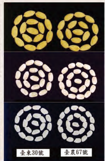
水稻臺東 30 號稻穀、糙米及白米外觀與臺農 67 號之比較。

於授權內容，若有疑問，請逕洽本場作物改良課丁文彥副研究員（089-325110 轉 611），相關資訊及附件均登載於本場網站（ http://www.ttdares.gov.tw ），請逕行上網查詢或下載。