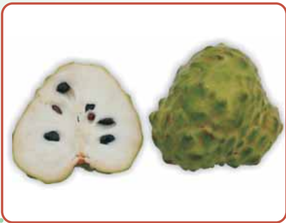
圖9. '蜜寶' 成熟果實及剖面