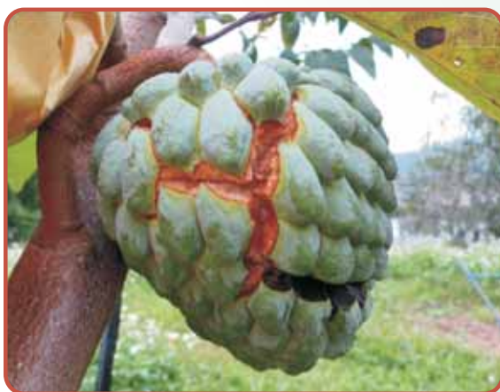
圖14. '青龍'果實低溫裂果