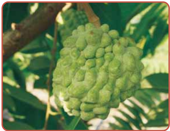
圖10. '蜜寶' 畸形果比率高