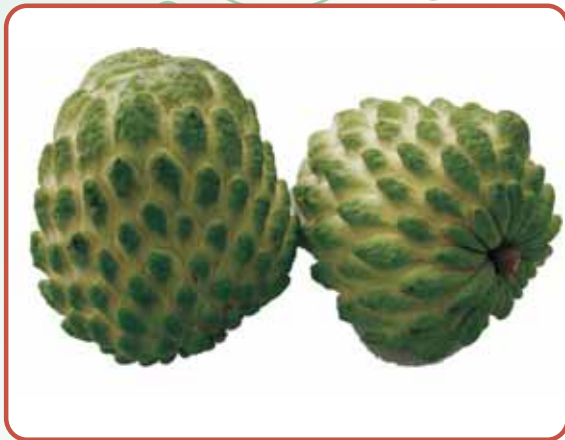
圖3. '綠鑽' 果實外觀

目，鱗溝為乳黃色，果頂較平(圖3)，每粒果實平均種子數約30.3粒，果肉為白色(圖4)，果肉率為68.2%，可溶性固形物含量23.5 °Brix(表1)，果肉具傳統釋迦風味。病蟲害部分與鳳梨釋迦相似，可參考其防治方法。夏期果(7~11月之果實)仍會有採後裂果情形(圖5)，冬期果產