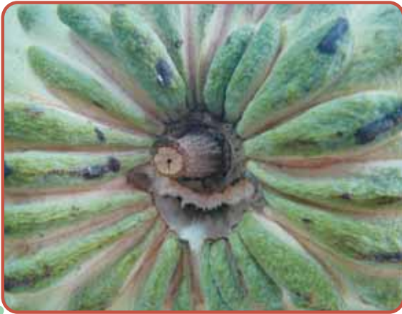
圖5. '綠鑽' 夏期果採收後裂果

管理方式均與鳳梨釋迦相似，結果樹齡早，優點為生長勢強、大果且豐產。缺點是人工授粉畸形果率仍高；果實軟熟時，果目易褐化(圖6)。