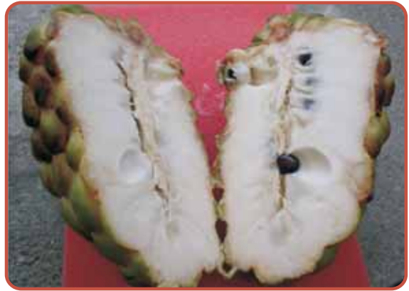
圖16. '黃金'之果實剖面