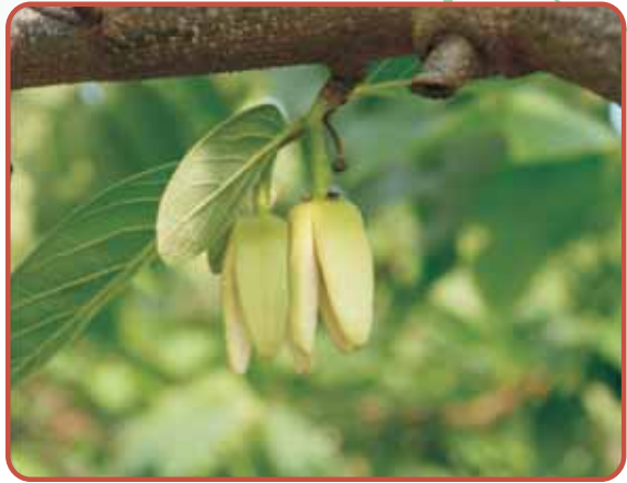
圖8. '蜜寶' 之花朵