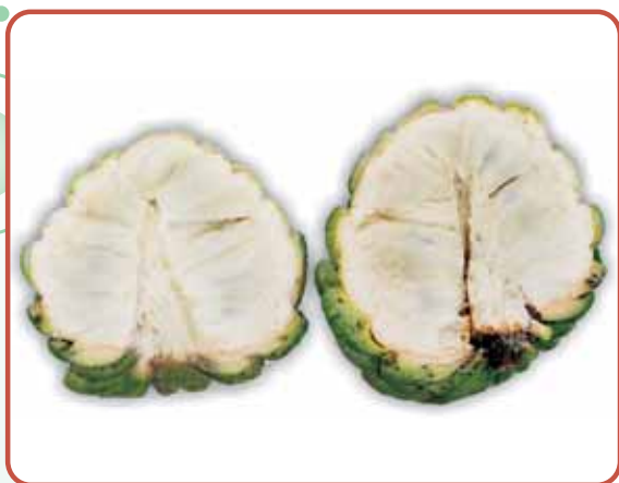
圖13. '青龍'之果實剖面