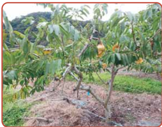
圖11. '青龍' 植株形態

色(圖13)，果肉率約48.0%，可溶性固形物含量26.3°Brix(表1)。病蟲害部分與番荔枝相似，可參考其防治方法。