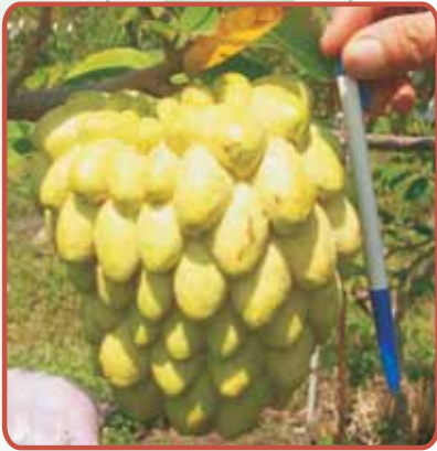
圖15. '黃金'之果實外觀

實屬超大型果，平均重量達884.4公克，果形為長圓錐形，果形指數為1.07；果實鱗目明顯突出，為淡黃綠色，鱗溝為淡黃色(圖15)；每粒果實約51.8粒種子；果肉為白色(圖16)，果肉率61.4%，可溶性固形物含量21.5°Brix(表1)。病蟲害方