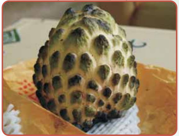
圖6. '綠鑽' 果實軟熟時鱗目易褐化