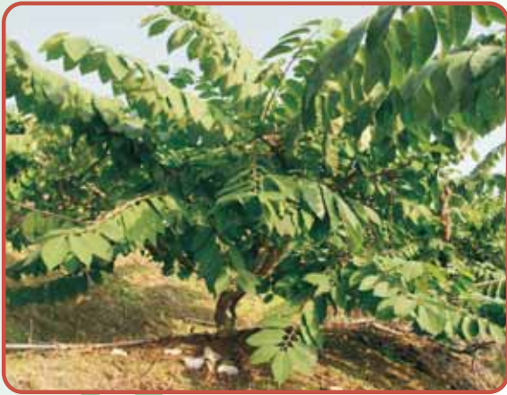
圖7. '蜜寶' 植株形態