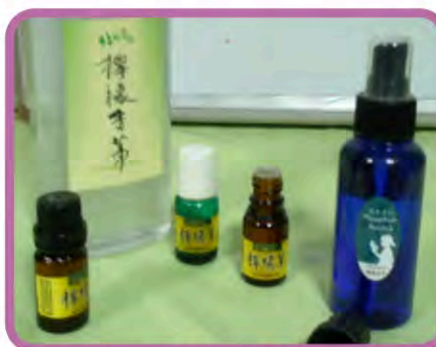
檸檬香茅精油及純露