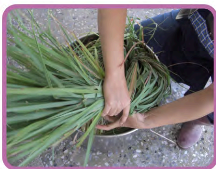
▶ 檸檬香茅草料的裝填

檸檬香茅一般常用水蒸氣蒸餾法萃取精油，利用加熱時溫度增高，精油和水均要加快蒸發，產生混合體蒸氣，其蒸氣經鍋頂鵝頸導入冷凝器中得到水與精油的液體混合物，經過油水分離後即可得到精油產品。香茅油一般呈黃色至暗黃色。