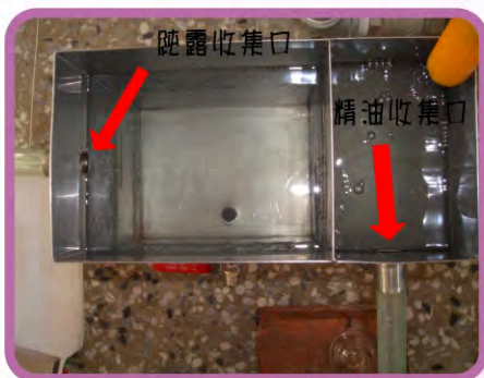
▶ 油水分離器外觀 (左邊收集純露；右邊收集精油)