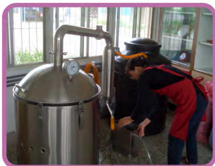
▶ 將裝填草料之鋼桶放進鍋身後，組裝萃取器後宜檢查確認各管線是否密合。