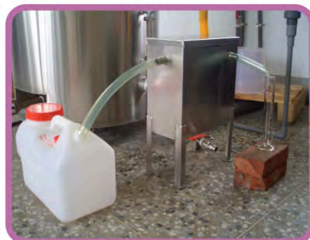
▶ 油水分離器近觀(左邊純露、右邊為精油)