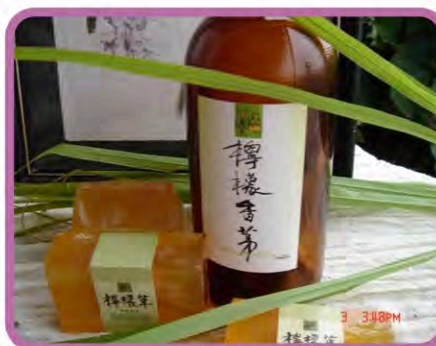
以檸檬香茅精油製作之手工皂