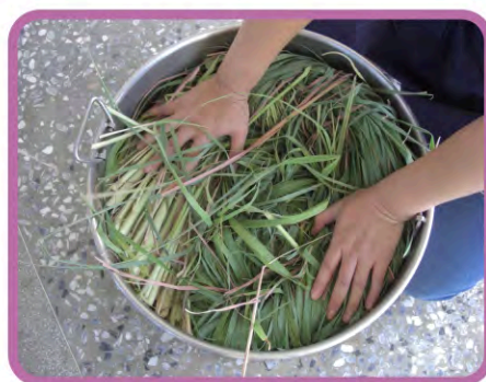
▶ 檸檬香茅草料的裝填壓實