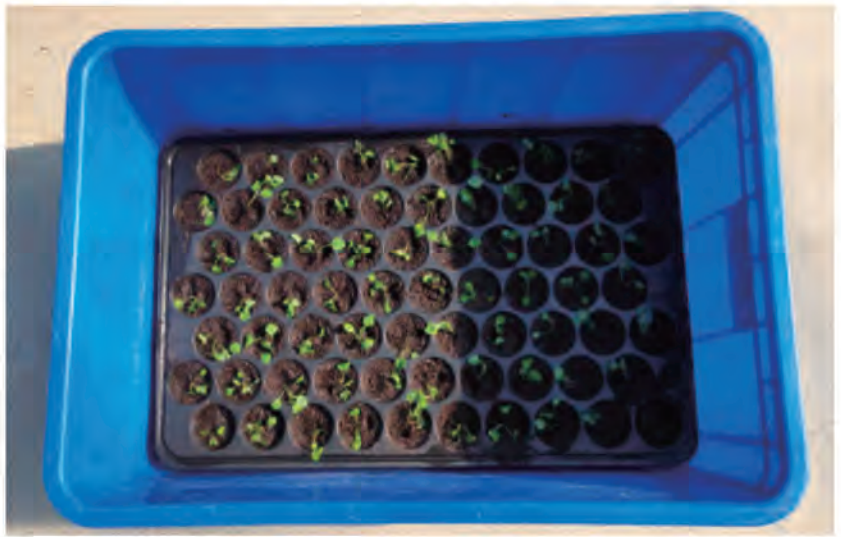
圖5. 將穴盤置於可蓄水的容器中進行育苗