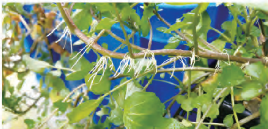
圖2. 豆瓣菜的莖節處，在潮濕環境下，容易發生不定根，可供繁殖使用。

在臺灣地區，據本場及花蓮區農業改良場研究觀察發現，豆瓣菜於平地及低海拔地區幾乎無法開花，僅海拔較高的山區，才有機會開花及生產種子。因此，雖然可以使用種子或無性方式來進行繁殖，但在臺灣，應以無性繁殖方式為宜，不適合使用種子來進行保種。此外，由於豆瓣菜喜潮濕多水的生長環境，可將培育的種苗種植在池塘或水田周圍，或營造半水生環境供其生長。