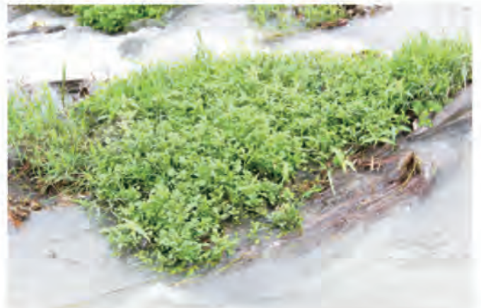
圖1. 生長於溪岸(左)及溪洲(右)的野生豆瓣菜族群