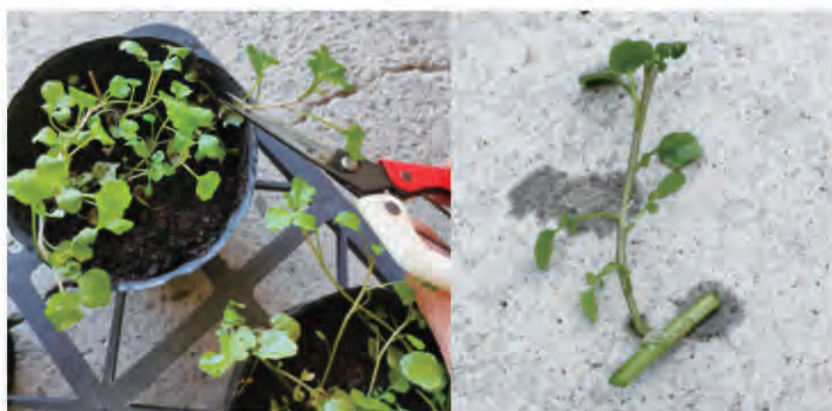
圖3. 剪取豆瓣菜扦插枝條(左)或莖節(右)