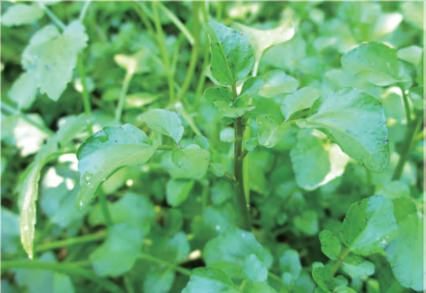
圖 / 文 薛銘童