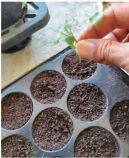
圖4. 將豆瓣菜插穗扦插入介質中

定植時，於前1~2日(視氣溫高低及穴盤水分蒸散程度)，將穴盤移出蓄水容器，降低介質水分，確保定植時，根系可以完整包覆穴盤內的介質，不因介質含水率過高而鬆散，造成移植的不便。如無適當之蓄水容器，亦可直接以穴盤育苗，惟需提高給水頻率，注意維持介質在充分濕潤狀態，以利育苗的成活率。