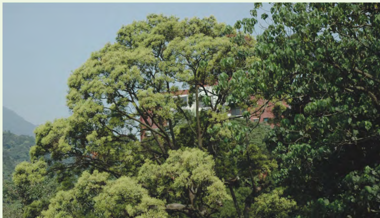
2~4月開花，圓錐花序，著生於枝頂，花小數多，黃綠色