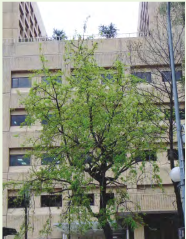
樟樹普遍栽植成景觀行道樹，初春展新葉，翠綠欣榮