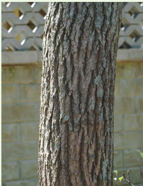
常綠大喬木，全株具芳香味，樹皮灰褐色，有縱裂深溝紋

據行政院衛生署中醫藥委員會編「臺灣藥用植物資源名錄」，《本草綱目》曰樟為「其木理多文章，故謂之樟。」意思是樟樹的木材上有許多紋章，所以在「章」字旁加一個木字，才有「樟樹」之名。