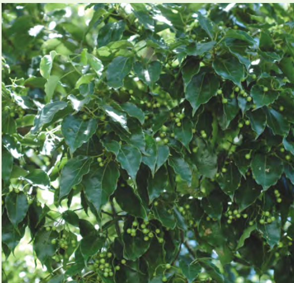
葉互生，革質，闊卵形，先端尖，離基三出脈，核果球形，熟時紫黑色

樟樹因全株含有一種「醚油細胞」，故會產生精油，是香氣的來源，這種香氣有除蟲的效果，樟腦油等產品就是得此而產生，有趣的是大家所熟習的「樟腦丸」，俗稱臭丸仔，並不是樟腦做成的，而是從石油中提煉出來的，因為具有樟腦味道，故以名之。