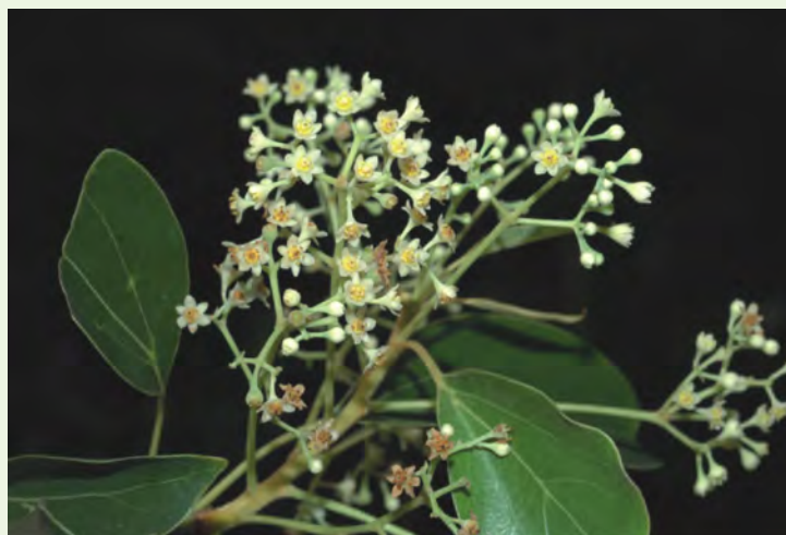
花被6片，雄蕊12枚， 排成四輪，花藥瓣裂

「百樣艱難百樣人，但為製棹最艱辛」—人生職場百百樣，皆自謂辛苦，但真正辛苦者是製作樟腦的工人。