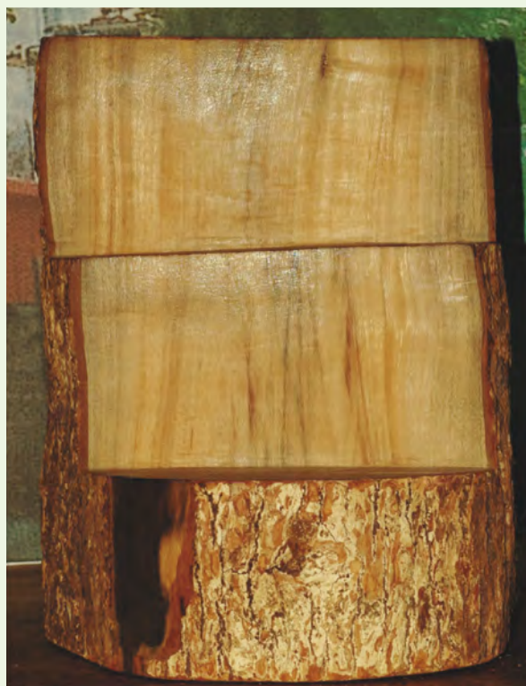
樟樹因全株含有一種「醚油細胞」，故會產生精油，是香氣的來源