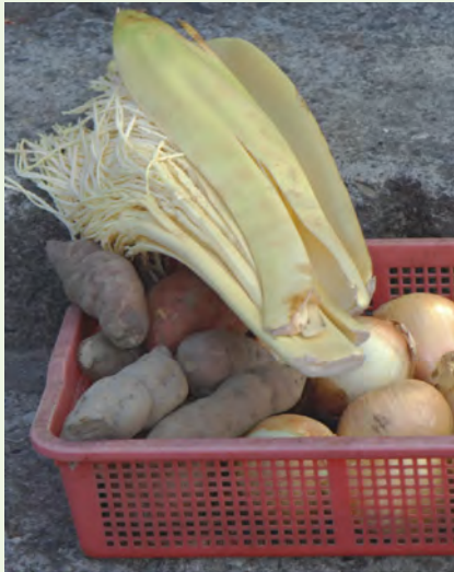
檳榔花是初生長的佛焰苞

檳榔因含有檳榔鹼，嚼食檳榔可能會導致口腔癌等不良後遺症，加上近年政府大力的宣導嚼食檳榔有害健康，致使檳榔產業稍有衰退，農民們變則通地開發出檳榔另類飲食，像半天筍、檳榔花，都是目前盛行的餐飲菜色。