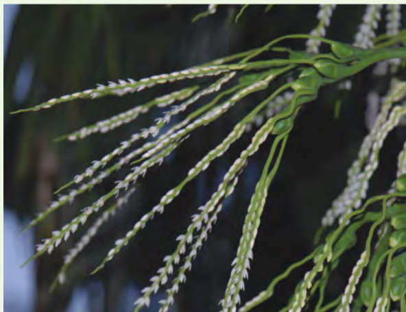
雄花多數長在先端，雌花著生在基部