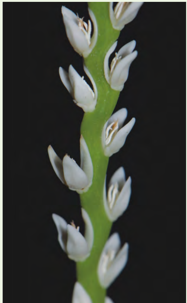
穗狀花序雄花特寫