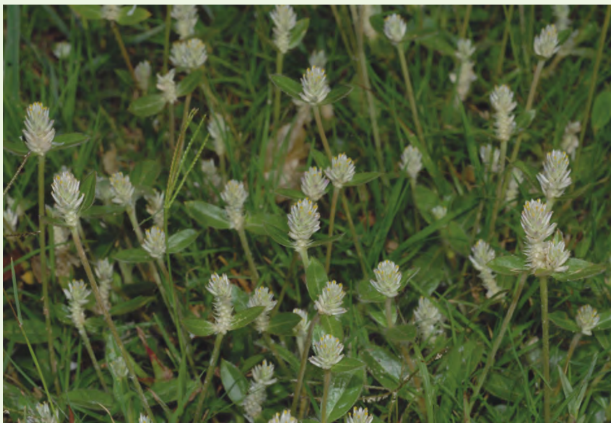
假千日紅屬逸出野生馴化種，是千日紅的同科弟兄

性狀： 一年生草本花卉，全株被有白色絨毛，莖直立，有稜，節部會膨大。單葉對生，長卵形至橢圓形，全緣，上下被白色毛，先端尖，基部楔形。穗狀花序球形，頂生，球形花由數十至上百朵小花組成。小胞果藏於紙狀的球花中。