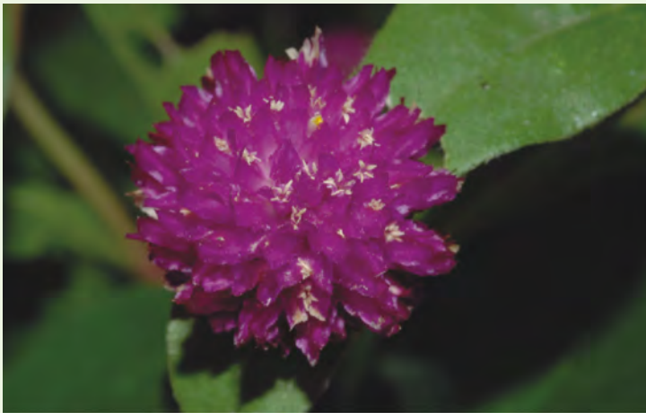
千日紅一般都作為花壇、盆栽，切花，也可以製成乾燥花

「圓仔花不知醜，大紅花醜不知」——順口溜，譏人自不知醜。圓仔花是「千日紅」別稱，朱槿俗稱「大紅花」，圓仔花和大紅花在民間到處都種來觀賞，日久習常，自然引不起人們的眼光注視。