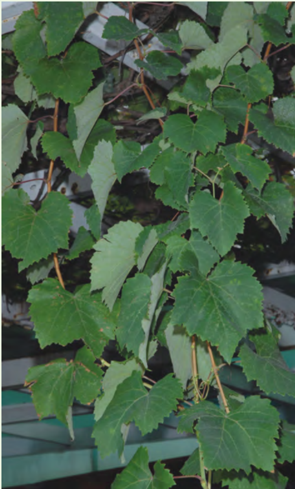
葉互生，寬大卵心形呈掌狀分裂，具有長柄，葉緣有鋸齒

性狀： 多年生落葉蔓性果樹，老莖表皮有明顯的龜裂痕跡。葉互生，寬大卵心形呈掌狀分裂，具有長柄，葉緣有鋸齒。花兩性黃綠色，複總狀花序作圓錐狀排列，五片花瓣，雄蕊五枚，開花時，花冠很容易脫落，只剩雌蕊和雄蕊。漿果圓至橢圓形，果肉半透明，有種子。