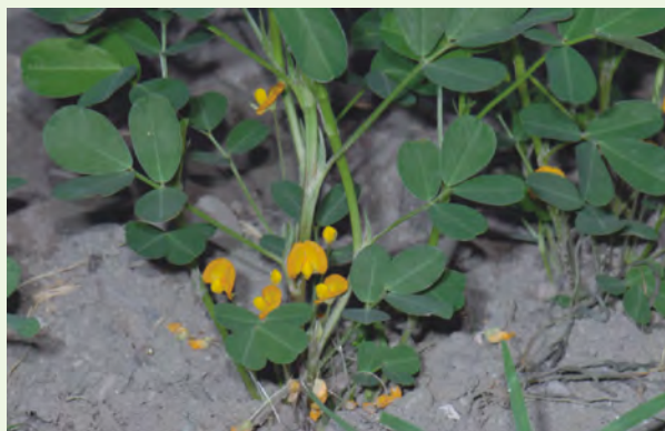
雌蕊受粉後，子房柄會伸長往下生長，把子房“推”到土壤裡