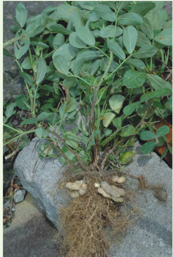
花生果實長在地下，故稱「落花生」