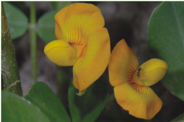
子房基部具有蜜腺以吸引昆蟲訪花增加授粉機會

性狀： 一年生的草本植物，可略分成直立型和匍匐型兩種。偶數羽狀複葉，小葉有二對，晚上會閉合。春季到秋季都可播種開花，花腋生葉下，蝶形花，黃色。莢果呈長筒形，略有腰身，莢殼上有網紋。