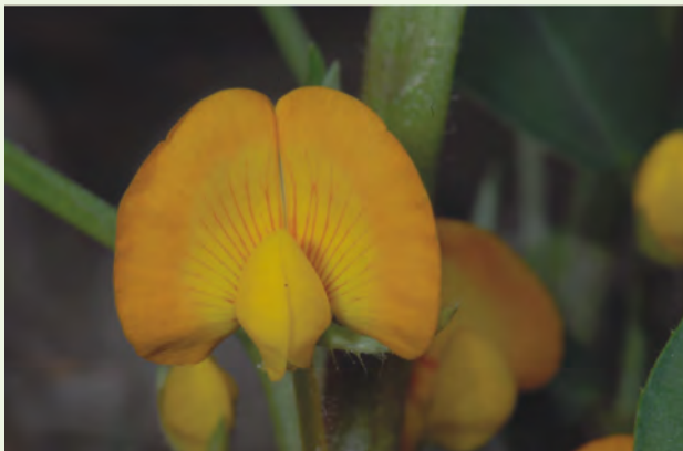
花兩側對稱，旗瓣、翼瓣和龍骨瓣形狀各不相同