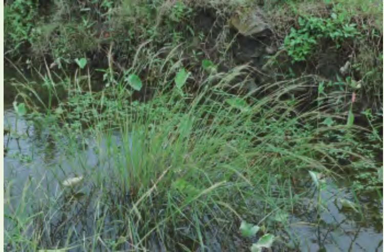
臺灣野生稻又名鬼稻

一心要死，一心要食米 一粒米，百粒汗 一粒飯，打死三隻狗 大風吹冇(冇Y、)粟 小暑，青粟，無青米 不去無米，要去黑陰 日本仔清飯一輪死(壽司) 月光沒曝得粟(〈一意) 冇粟收落好米籃 四月四日晴，稻稈較大楹 四月初一雨，空歡喜 四月初二雨，有花結無籽 四月初八雨，稻稈曝到死 四月初三雨，有粟做無米 未落滿，先食落滿米 甘願擔領一石米，不願擔領一個因仔痞 生米，煮熟飯 立夏雨水淒淒，米粟刈到無處置 吃米拜田頭，吃果子拜樹頭 狗食秫米一無變 秋甲子雨，稻生兩耳 食米食粟，較熟人 偷掠雞，也著了一把米(也著：也得要) 偷割稻，施捨糜 欲死去死，毋死食了米 麥驚清明尖葉雨，稻驚秋來白日風 無米有春白，無困抱新婦 煩惱十三代困孫，無米通煮 飽穗的稻仔，頭攏犁犁 緊火冷灶，米心哪會透 儉色較贏儉粟 播田面憂憂，割稻撚喙鬚 豬不肥，肥佇狗；稻仔不長，長佇草 閻羅王無米一枵鬼 糶米賣布，賺錢有數