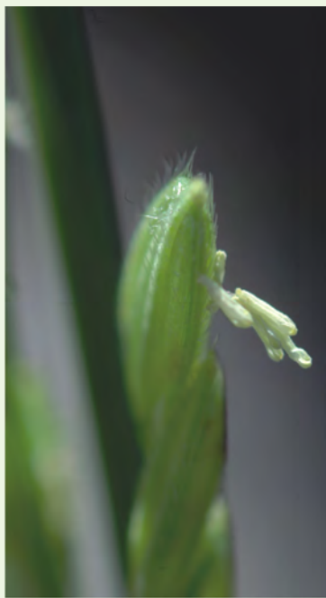
雄蕊有6枚，花藥白黃色