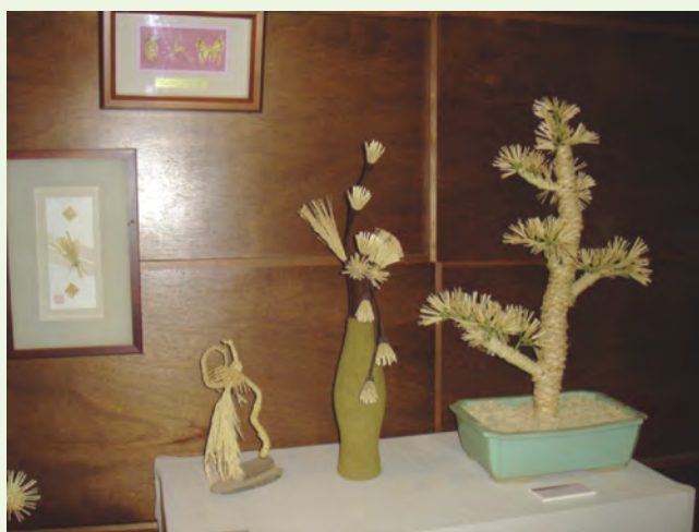
稻稈也可以藝術化

我們吃的白米其實就是稻子的澱粉質胚乳。稻米在收割之後，去掉了外殼的白米，稱為糙米。糙米含92%胚乳，3%胚芽，5%米糠層，米糠層是由果皮、種皮、糊粉層所組成，纖維質地粗糙，水份不易浸入，煮出的糙米飯粗硬而且粘性低，必須碾去米糠層，剩得的胚芽米，再去掉胚芽，就是市面上看到的精白米。