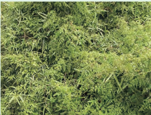
圖 1. 海金沙。

蔓藤類，葉片可連續無限制地生長，長可達10公尺以上，羽片2~3回，孢子囊兩列併排於小羽片之指狀裂片上。