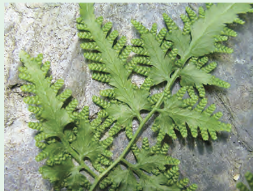
圖 2. 海金沙孢子囊群。