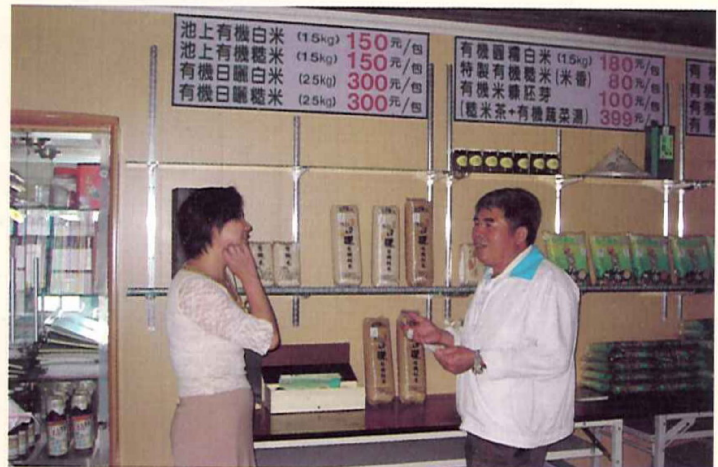
▲大地有機米展售場所

農作物有機栽培觀察及示範計畫，自推動成立至今已屆十年；由選擇品質良好的水稻品種、優良的生長環境及無污染的土壤與灌溉水的選定、適當的肥培管理與病蟲害防治方法的推薦，一直到產銷通路的建立，一路走來的確辛苦而且不容易。經過這些年來的努力，大家都已了解水稻採用有機栽培具有土地永續經營、環境保護、農業廢棄物再循環