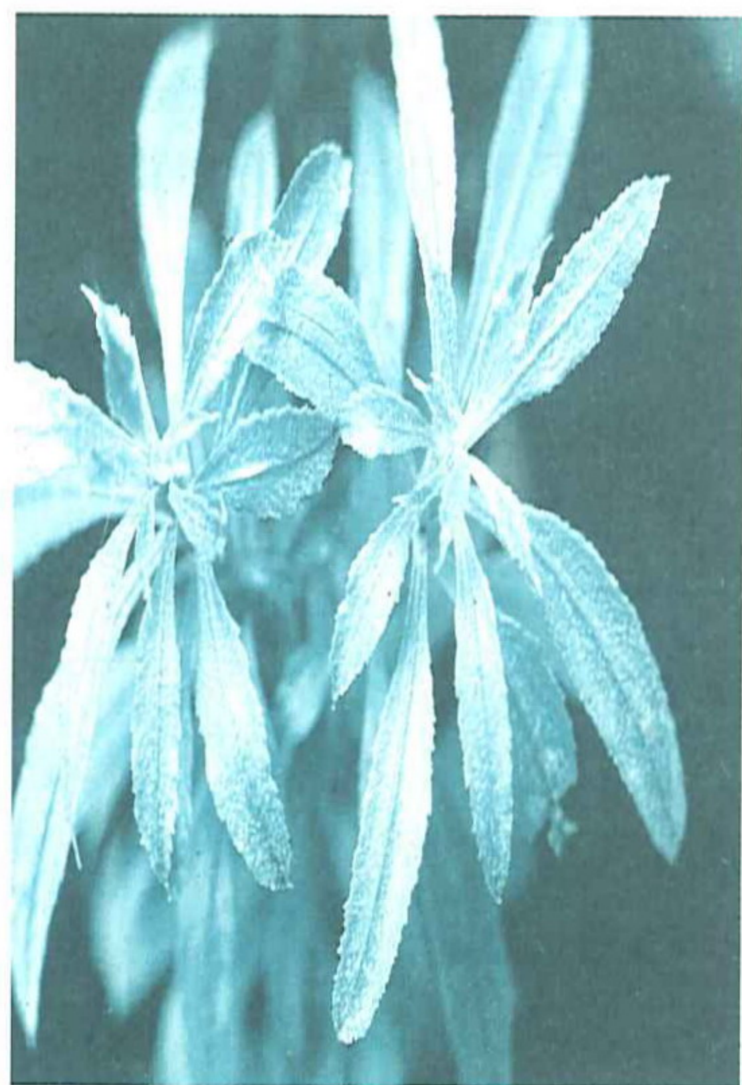
栗蕨具有無限生長的葉片

特別注意的是蕨與我們在菜市場買得到的過溝菜蕨 Diplazium esculentum (Retz.) Sw. 是不同的種。過溝菜蕨俗稱過貓，屬於蹄蓋蕨科，雙蓋蕨屬。它的孢子囊群