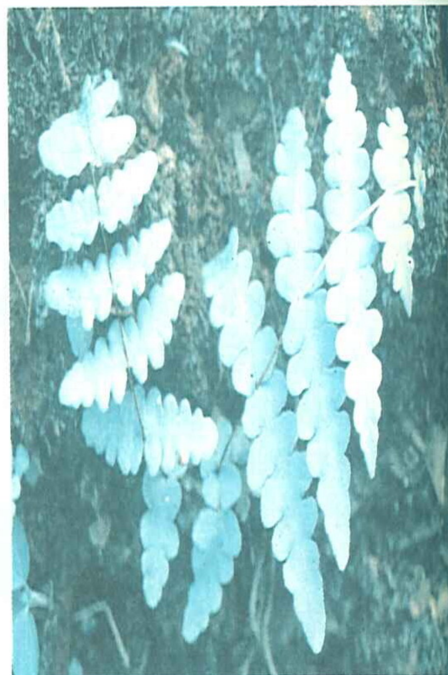
歐美常用來當作茶葉替代品的鐵線蕨，大量食用會造成嘔吐之症狀