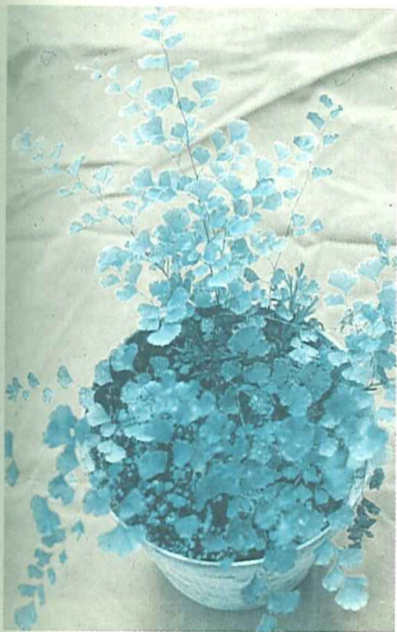
有毒蕨類栗蕨的植株

吃 的安心，吃出健康，是現代人對食物之基本要求。也因此有部份民眾趁著登山休閒或野外旅遊時順便採集一些野菜回家煮食。如果採集到鮮嫩可口、養顏補身的種類可說是值回票價，如果不小心中採到有礙身心健康的可就慘了，不可不慎。