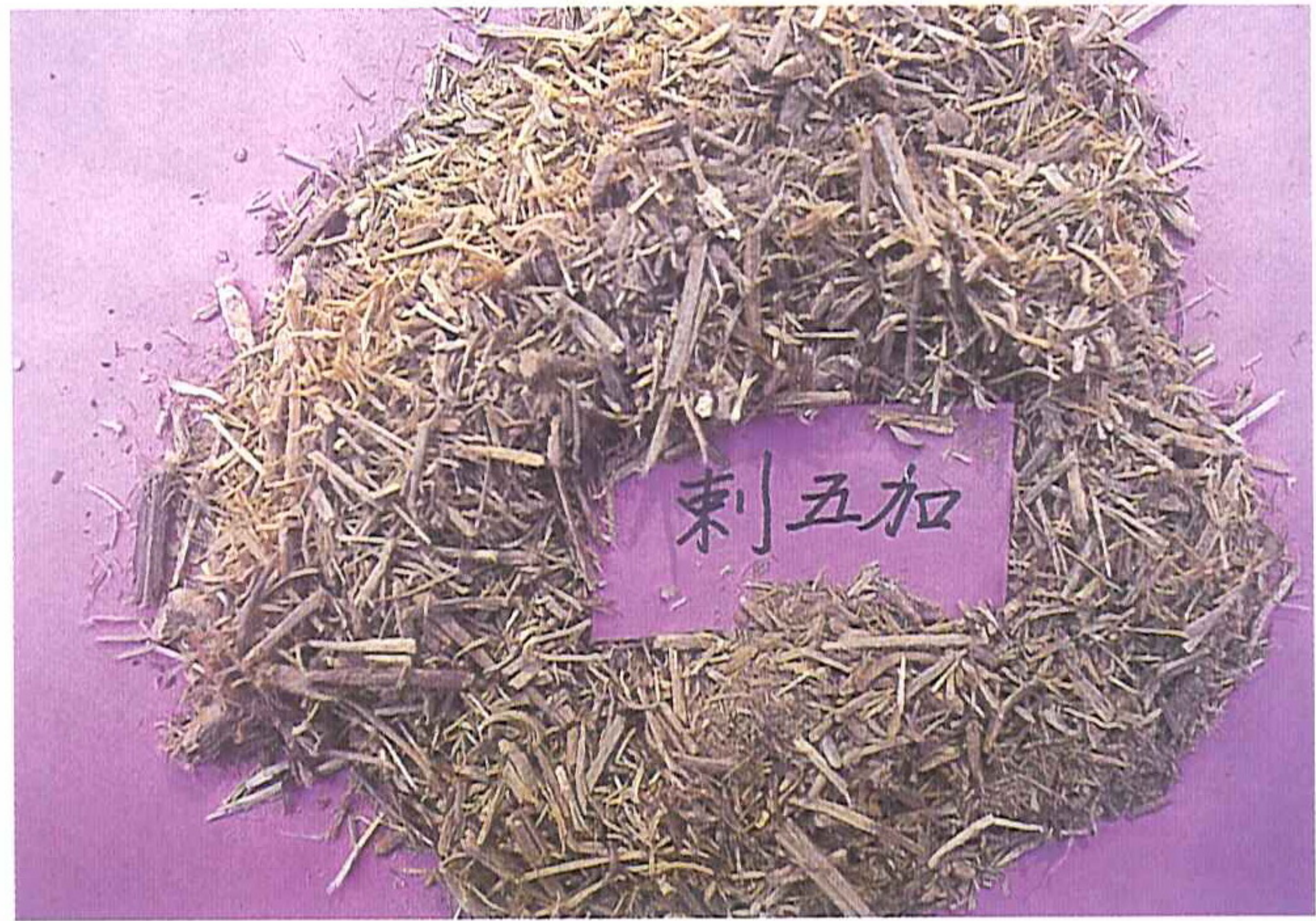
刺五加扦插育苗成活之種苗

性溫，味辛，微苦，益氣健脾，補腎安神。據蔡(1997)「刺五加的藥用認識」撰述：刺五加含多種甙類，主成分為 \beta -sitosterol-glucoside (Eleutheroside) (刺木骨甙) (刺五加甙)、Syringin、Isofraxidin，三種成分以根、根莖和莖的皮部含量最高。另從根中分離出七種刺五加甙(A、B、C、D、E、F、G)其含量比例為8:30:10:12:4:2:1，從葉中分離得以齊果酸(oleanolic acid)為配基得五加葉甙(I、K、M)等，其它尚有微量元素鋅、銅、錳等。主治用於脾腎陽虛，腰膝酸軟，體虛乏力，失眠多夢，食慾不振等。高(1982)「新編中藥大辭典」撰謂：根含多種糖甙(0.6-0.9%)，其中有胡蘿蔔甙醇、7-羥基-6,8-二甲氧基香豆精d-葡萄糖甙、乙基d-半乳糖甙、丁香樹脂酚葡萄糖甙、丁香(Syringin)等。此外，尚含芝麻素、多糖(2.3-5.7%)。莖含糖甙0.6-1.5%。果實含水溶多糖17-20%，其中含果膠物質。功用主治用於祛風濕，壯筋骨，活血去瘀等。