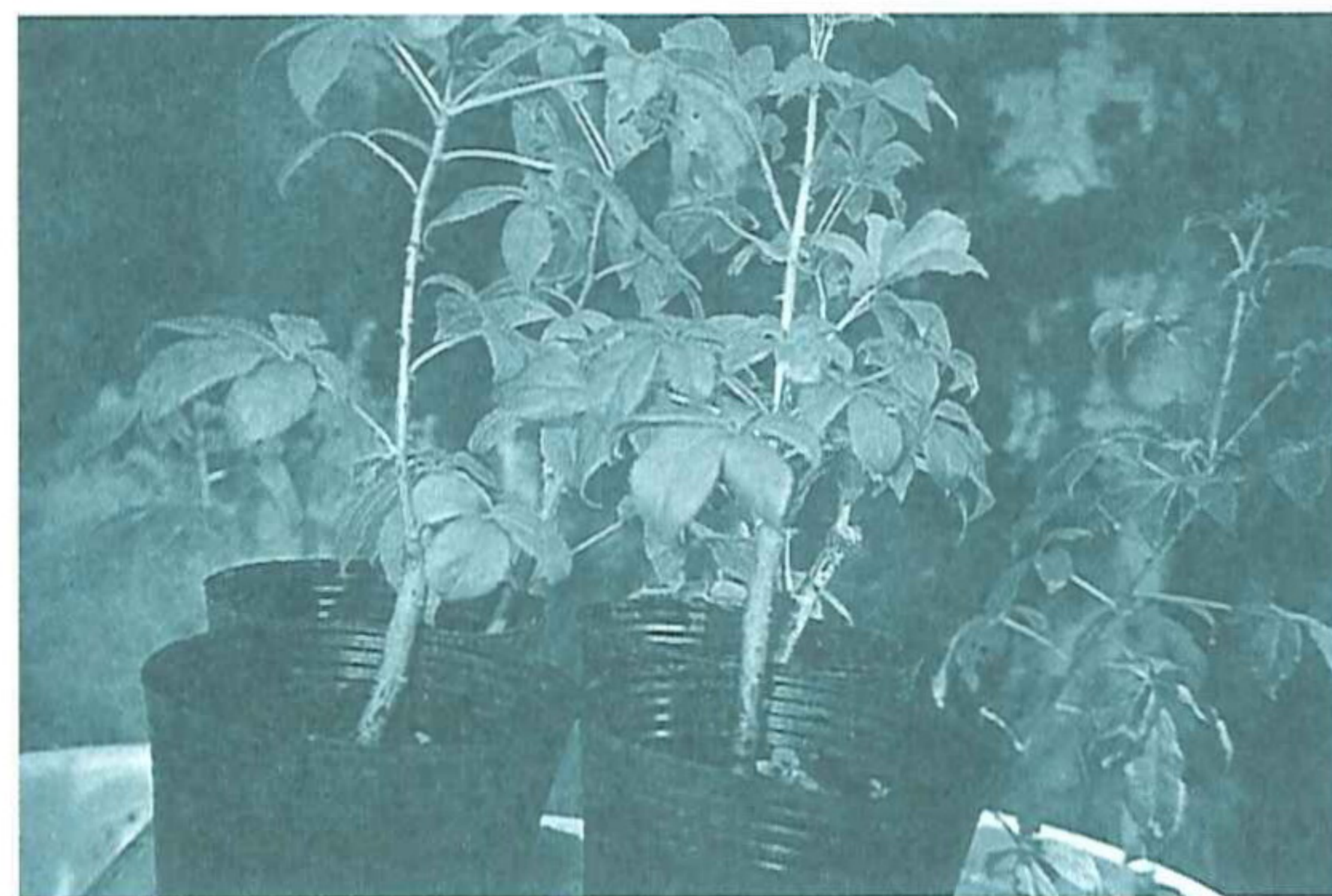
刺五加根、莖經粉碎後供藥材用