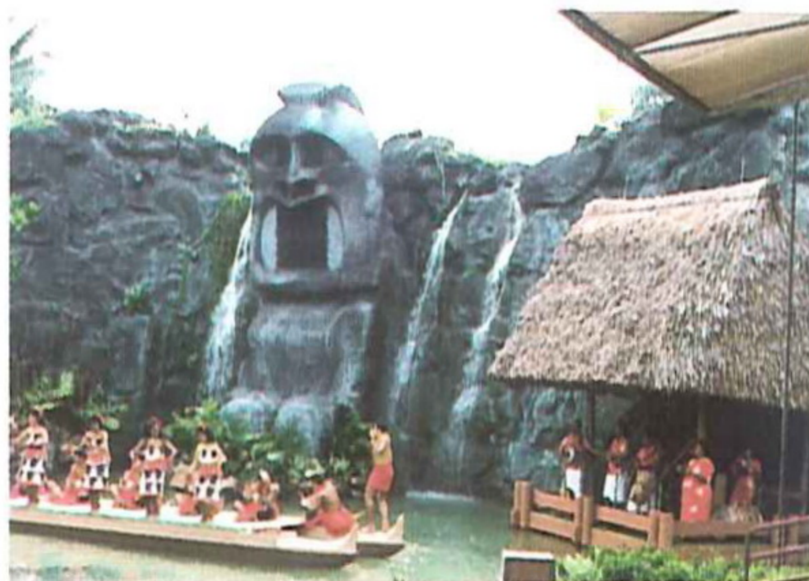
△仿各族傳統的建築及祭祀神社

夏威夷以觀光休閒聞名世界，也是該州的主要產業及收入，夏威夷為統合太平洋島國如紐西蘭、夏威夷、東加等主要的玻里尼西亞族群的文化，吸引觀光客前來觀賞，特別設置玻里尼西亞文化中心，以民俗傳統文化活動為主題吸引遊客前來觀光消費。