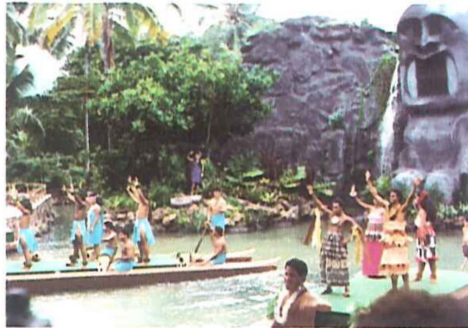
△以傳統文化為主的運河舞蹈表演來形容並不為過。

「到夏威夷沒到玻里尼西亞文化中心，就不算到過夏威夷」這是夏威夷人的驕傲豪語。該中心位於夏威夷州歐胡島北部，由檀香山（Honolulu）前往約需60分鐘車程，也可搭公車，交通便捷，整個中心占地約10.5公頃，全區有人工運河貫穿，並定時表演南太平洋各族的傳統文化慶典活動及沿河遊行，極為生動熱鬧，也會讓遊客上船同遊；各族的傳統建築、祭祀、手工藝品、生活習俗、飲食等均經過研究考察，仿原型建造再經包裝設計形成生動活潑的賣點，以絕無冷場