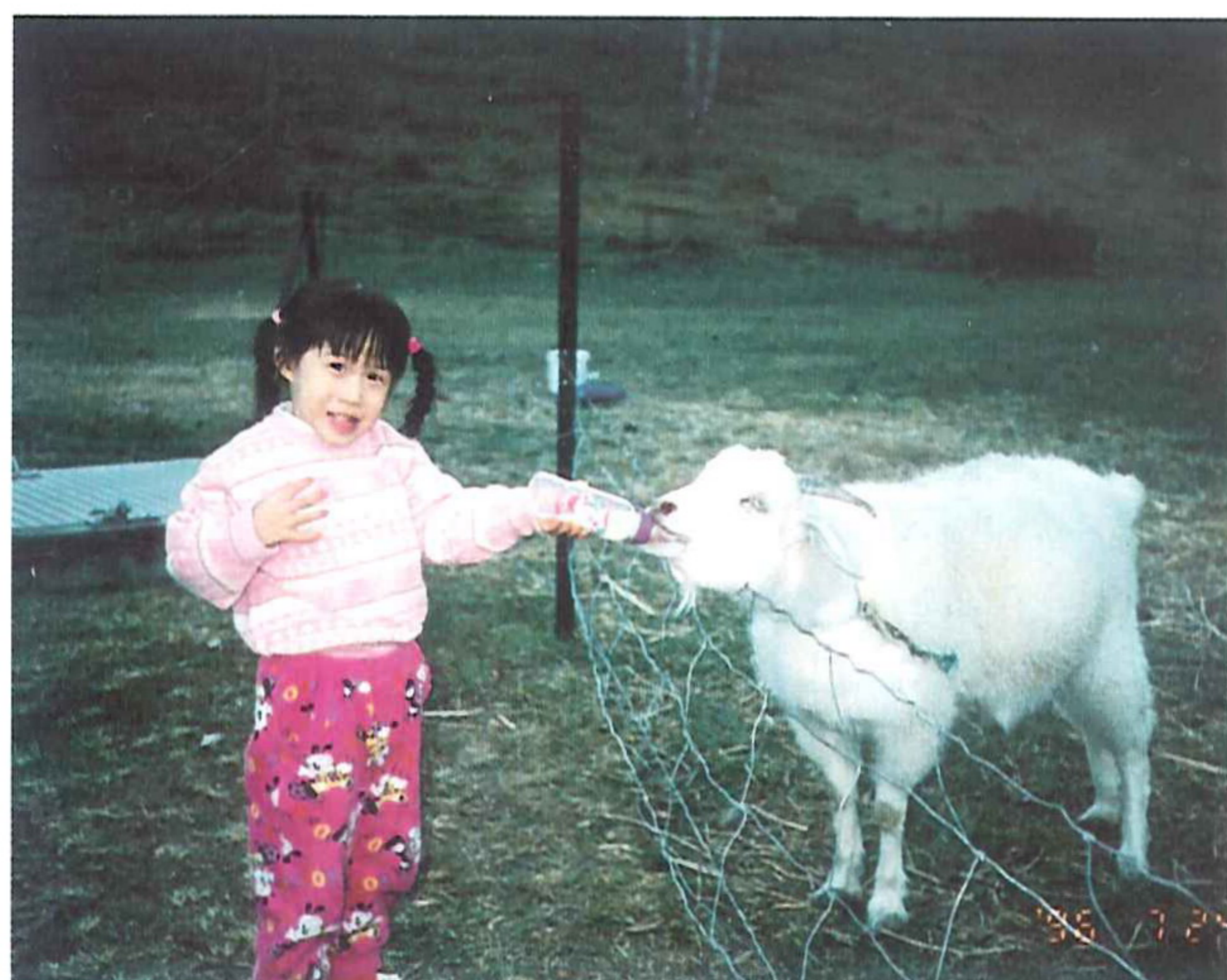
△餵羊吃奶，怕怕又好玩