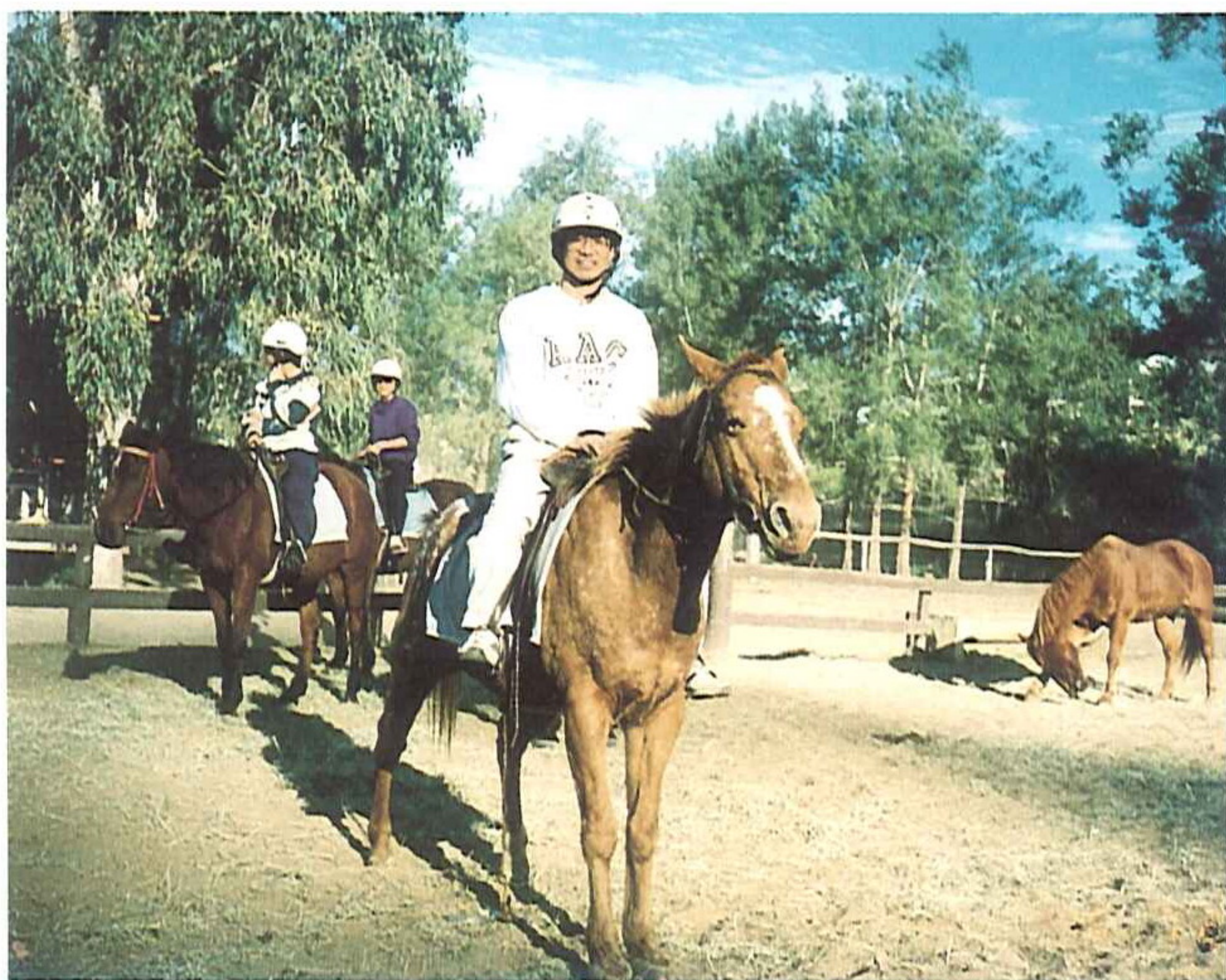
△騎馬是農場主要活動

庫拉賓休閒農莊面積約2500公頃，以牛、羊畜牧為主，由於農場廣大，內設有小型機場供農場管理之需，該農場也是最早發展觀光休閒活動的農場之一，其活動以騎馬、擠牛奶、牧羊狗、馴羊、剪羊毛、紡毛線、小孩餵羊奶、擲迴力鏢、甩皮鞭及牧羊人煮茶、