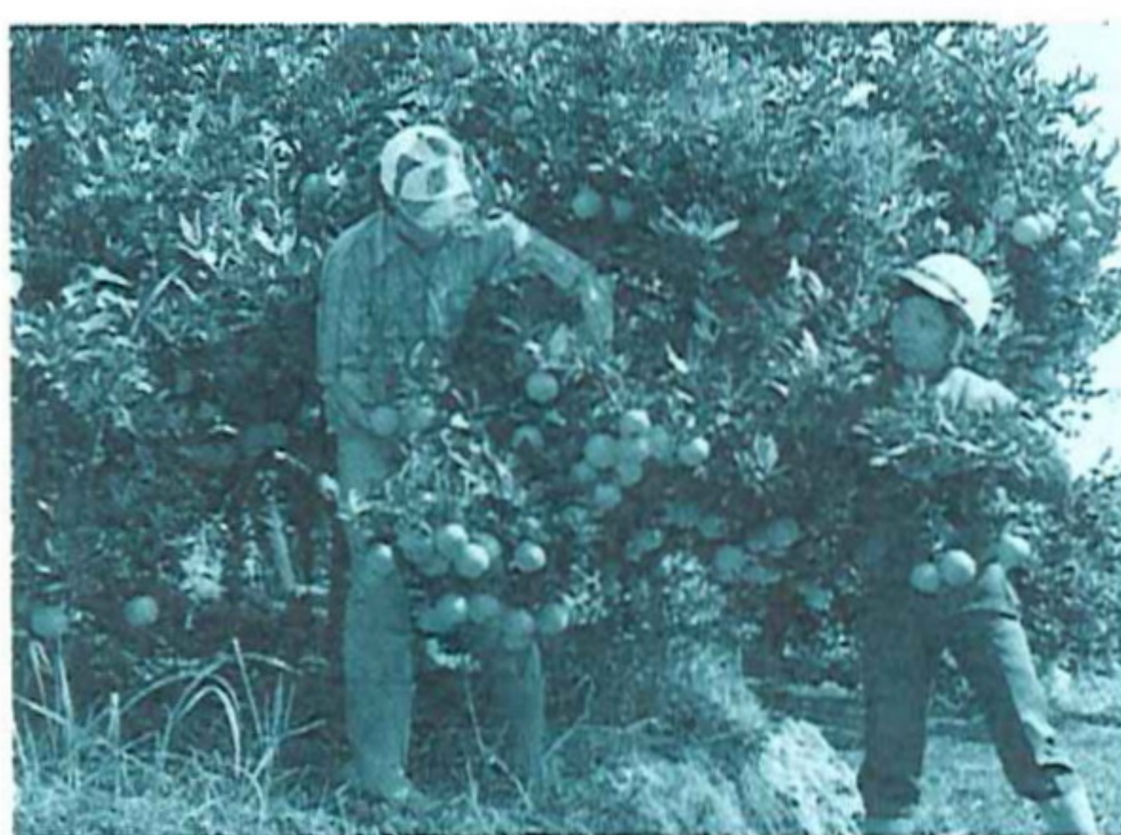
△柑桔觀光果園開放採果

目前已輔導開放卑南鄉觀光花園4公頃、鹿野鄉觀光茶園46公頃、關山鎮觀光果園14公頃、東河鄉綜合觀光果園55公頃、成功鎮觀光果園22公頃，今後將改進開放經營型態，輔導園區環境及現代農園改良設施強化經營班組訓教育，加強觀光農園教育宣導，提供民衆觀光農園資訊，增進民衆參與感，鼓勵民衆前往遊憩採果，提高觀光農園產品價值觀，增加產地消費，增加農民所得，繁榮農村經濟。