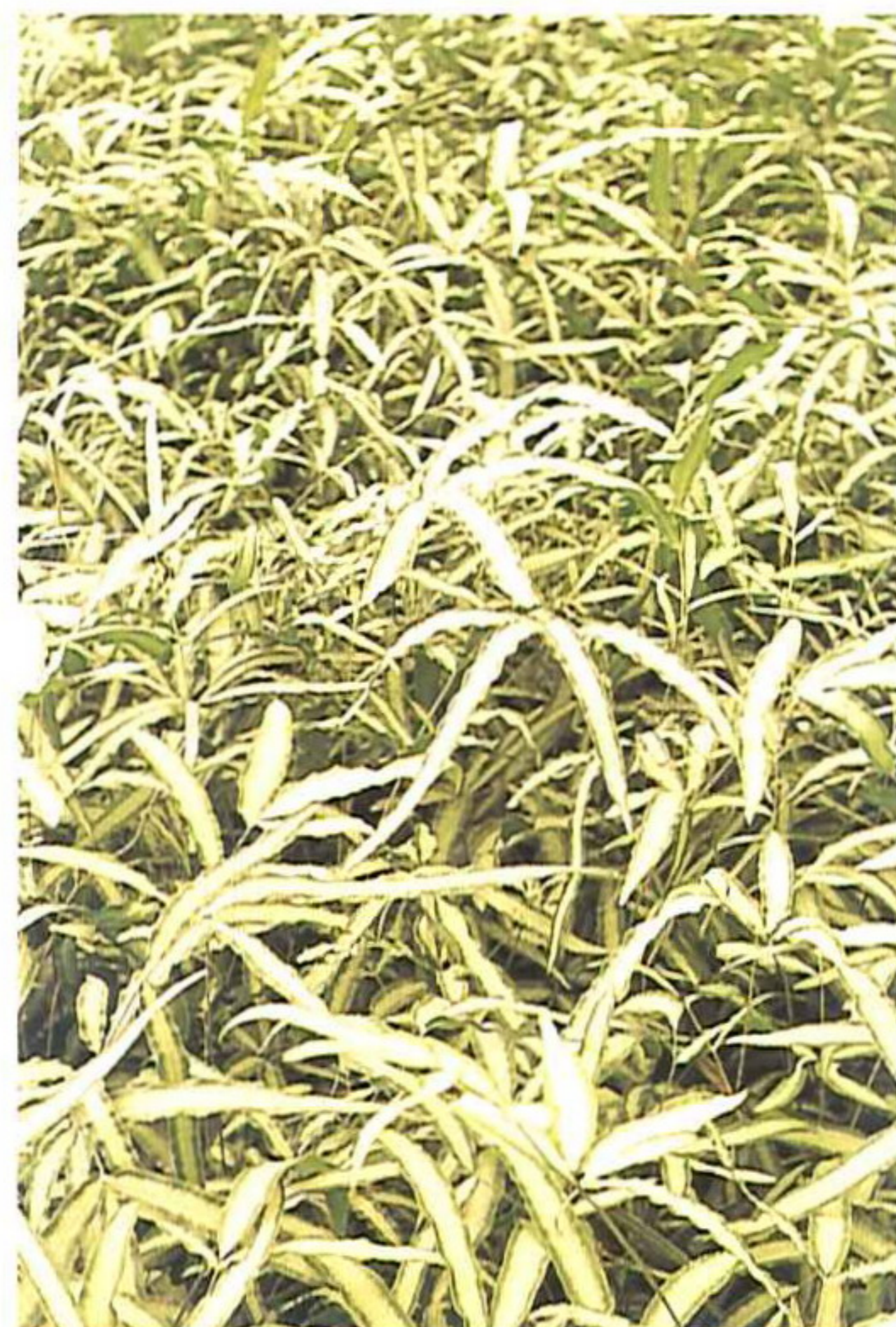
銀脈大葉鳳尾蕨植株。

長25公分左右，葉寬15公分左右，葉頂端凹陷，凹陷處葉柄突出形成一段刺狀物，葉形有點像鐵扇公主的扇子，但稍長，葉厚。植株生育旺盛，葉片茂密，有時會有50公分左右之不規則葉片長出，可予以修剪，維持株型。