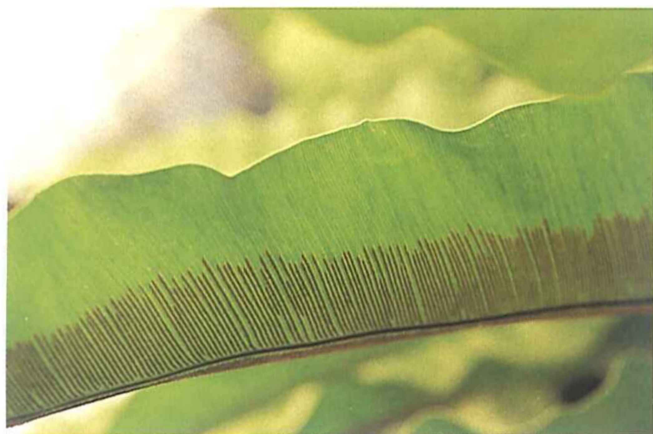
台灣山蘇花葉背之孢子囊群。