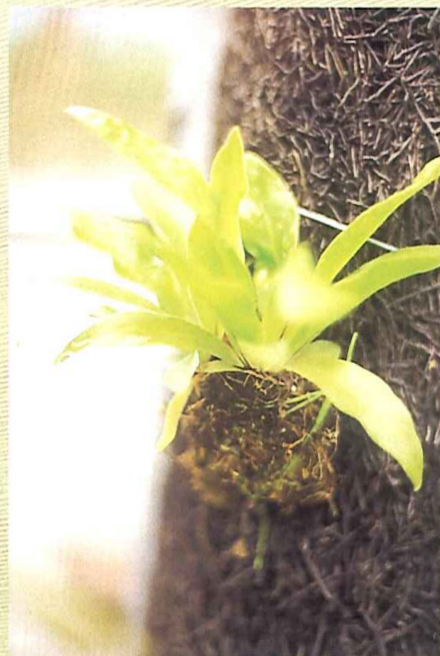
植於蛇木幹上之台灣山蘇花。