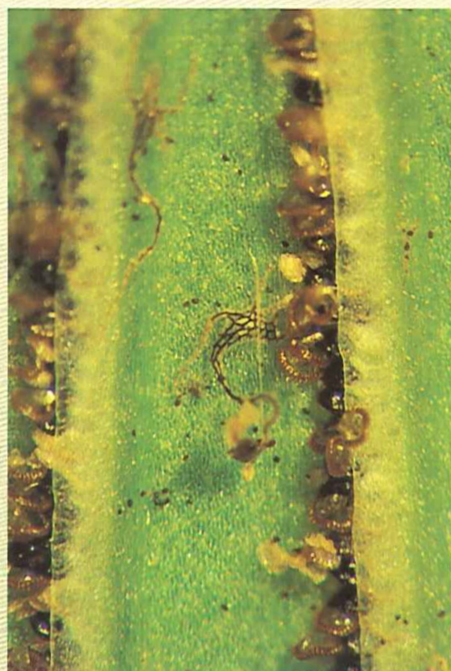
革葉鐵角蕨葉背之孢子囊群。