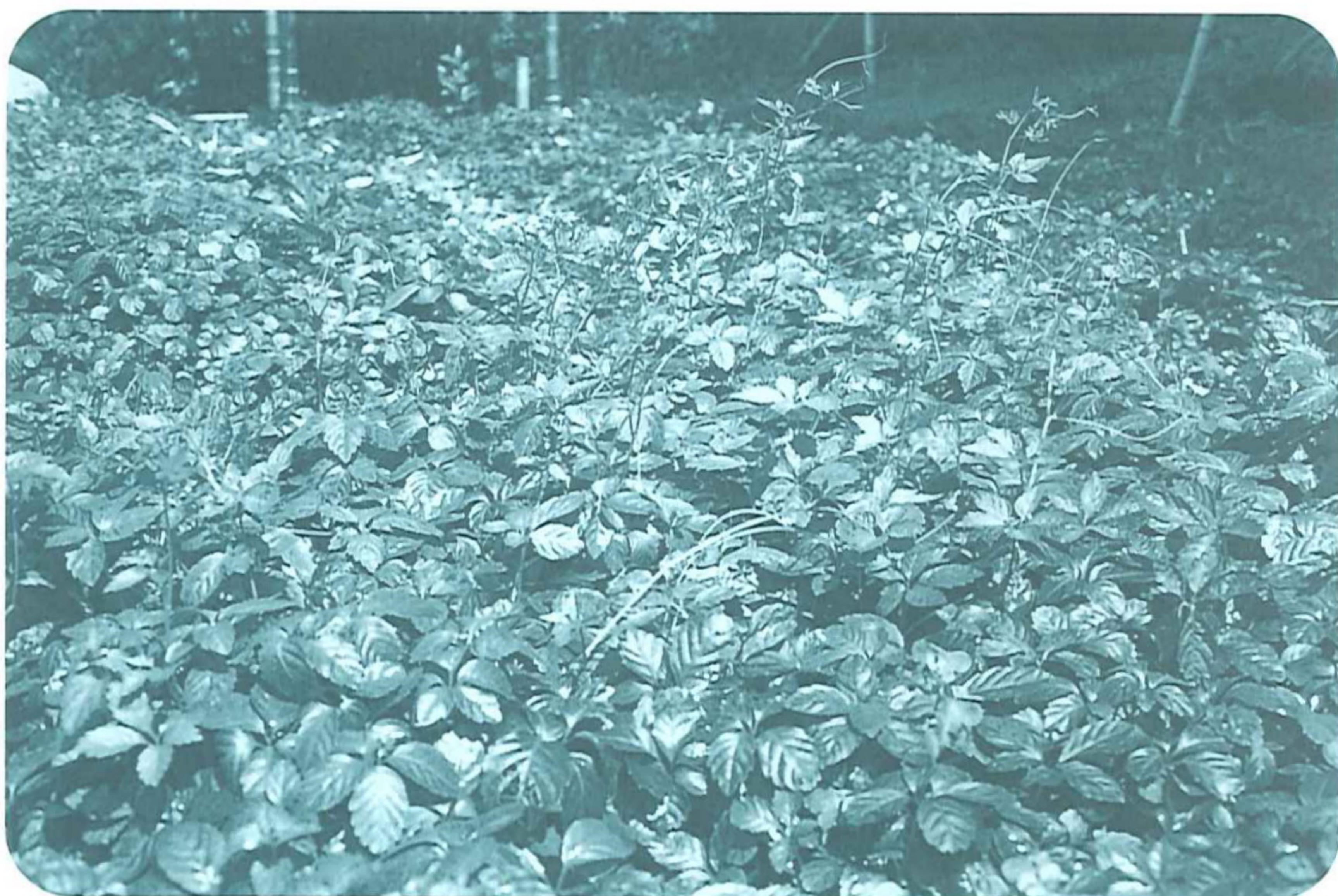
五葉參作畦栽培植株披覆地面生長