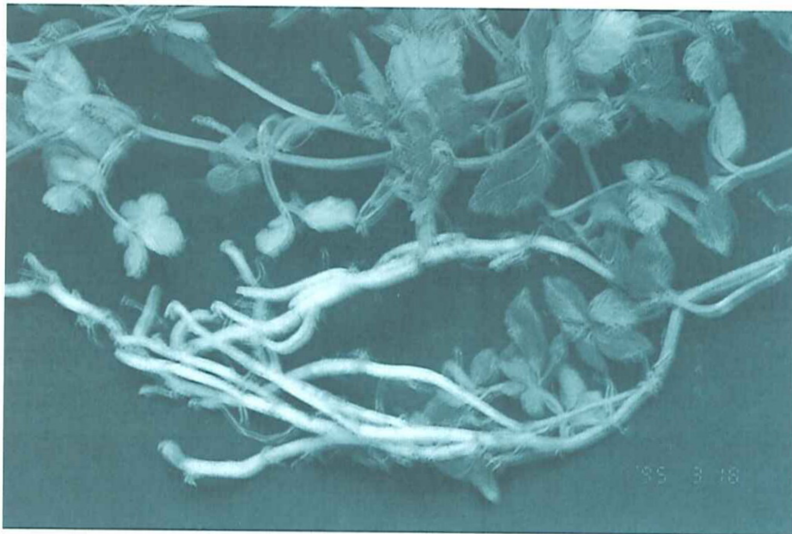
五葉參的莖蔓及根

片成熟即可收穫。一般收穫時期每年二次，第一次於6~7月，第二次於10~11月，每次公頃莖葉總產量乾品為1,000~2,000公斤，全年乾品產量為2,000~4,000公斤/公頃。五葉參收穫宜選擇晴天收割，收割時可留頭3~5cm或留下1~2枚下葉，以供下期作之萌芽生長。將莖葉割取後用水洗滌，祛除泥垢、灰塵及檢拾