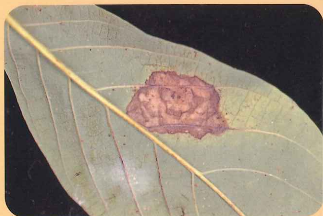
圖十一、葉片炭疽病病徵