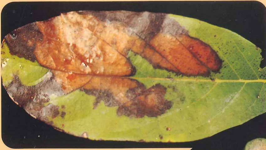
圖七、疫病菌感染葉片之病徵