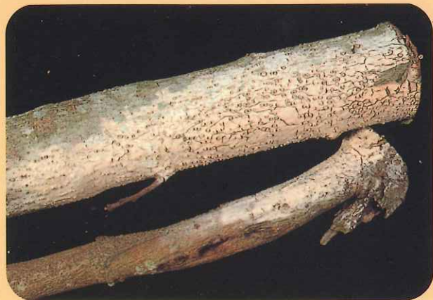
圖十、赤衣病為害莖部