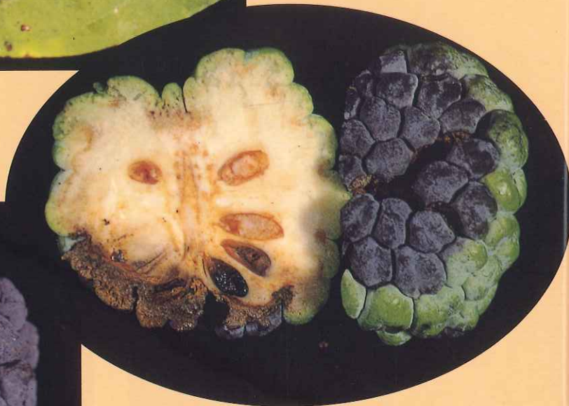
圖八、黑潰瘍病病徵