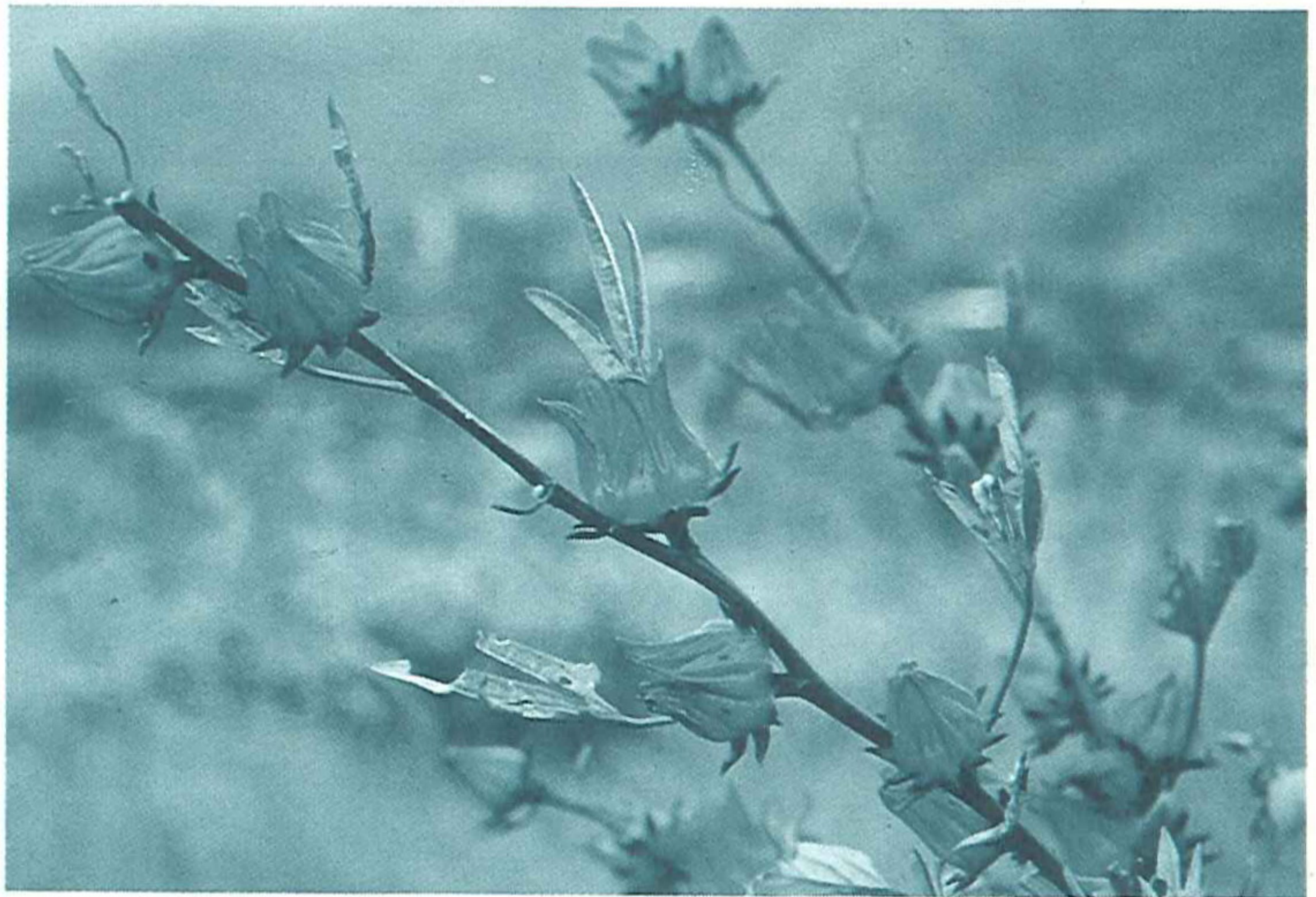
◎鮮豔欲滴的洛神花

洛神花果實萼片富含多量果膠質，因此可供製果醬、果汁、果凍、糖蜜餞及加糖釀造果酒，製造品色味俱佳，未熟果可作醋或鹽漬佐餐，葉可生食或煮作染料，本省所產洛神花大多採收花萼，經去子、焙乾製成洛神花茶。