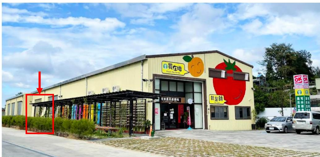
圖 2、報到處入口(紅框處)