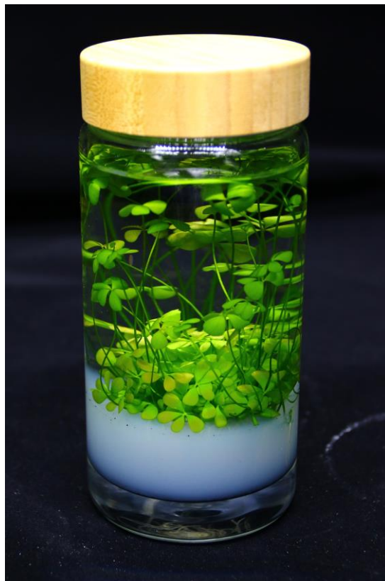
田字草無菌水草瓶之商品示意